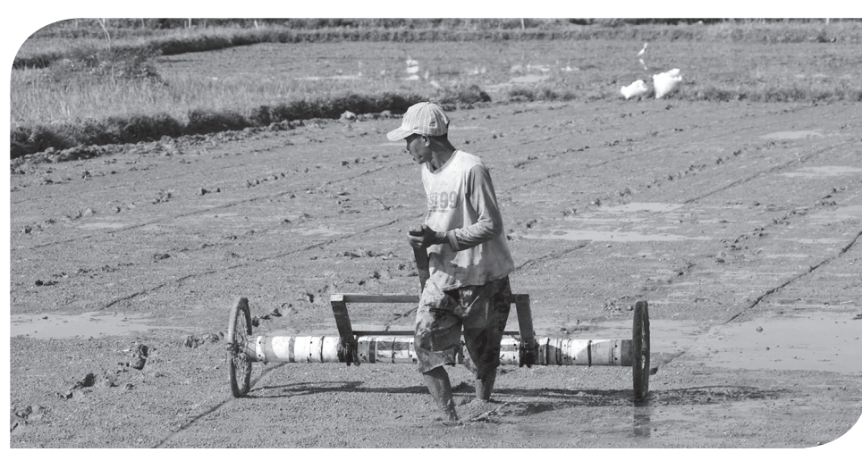
TANAM PADI DENGAN SISTEM TABELA