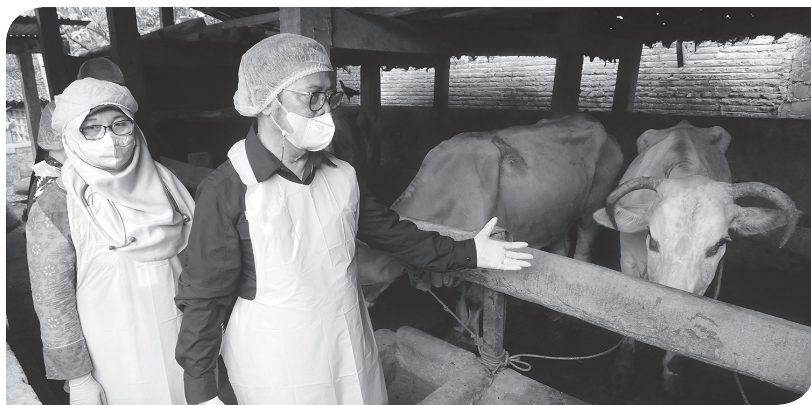
MENTERI PERTANIAN MENGECEK KASUS PMK DI BOYOLALI